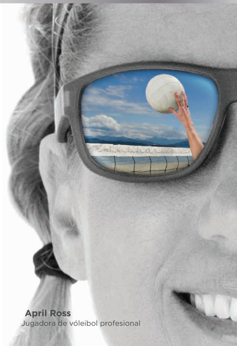
April Ross Jugadora de vóleybol profesional

©2016 Essilor of America, Inc. Todos los derechos reservados. A menos que se indique lo contrario, todas las marcas comerciales son propiedad de Essilor International y sus subsidiarios en los Estados Unidos y en otros países. Transitions y the swirl son marcas comerciales registradas de Transitions Optical, Inc., utilizadas bajo licencia por Transitions Optical Limited. El rendimiento fotocromático está influenciado por la temperatura, la exposición a rayos UV y el material del lente. LXPE000392 SHK/SSX 10/16